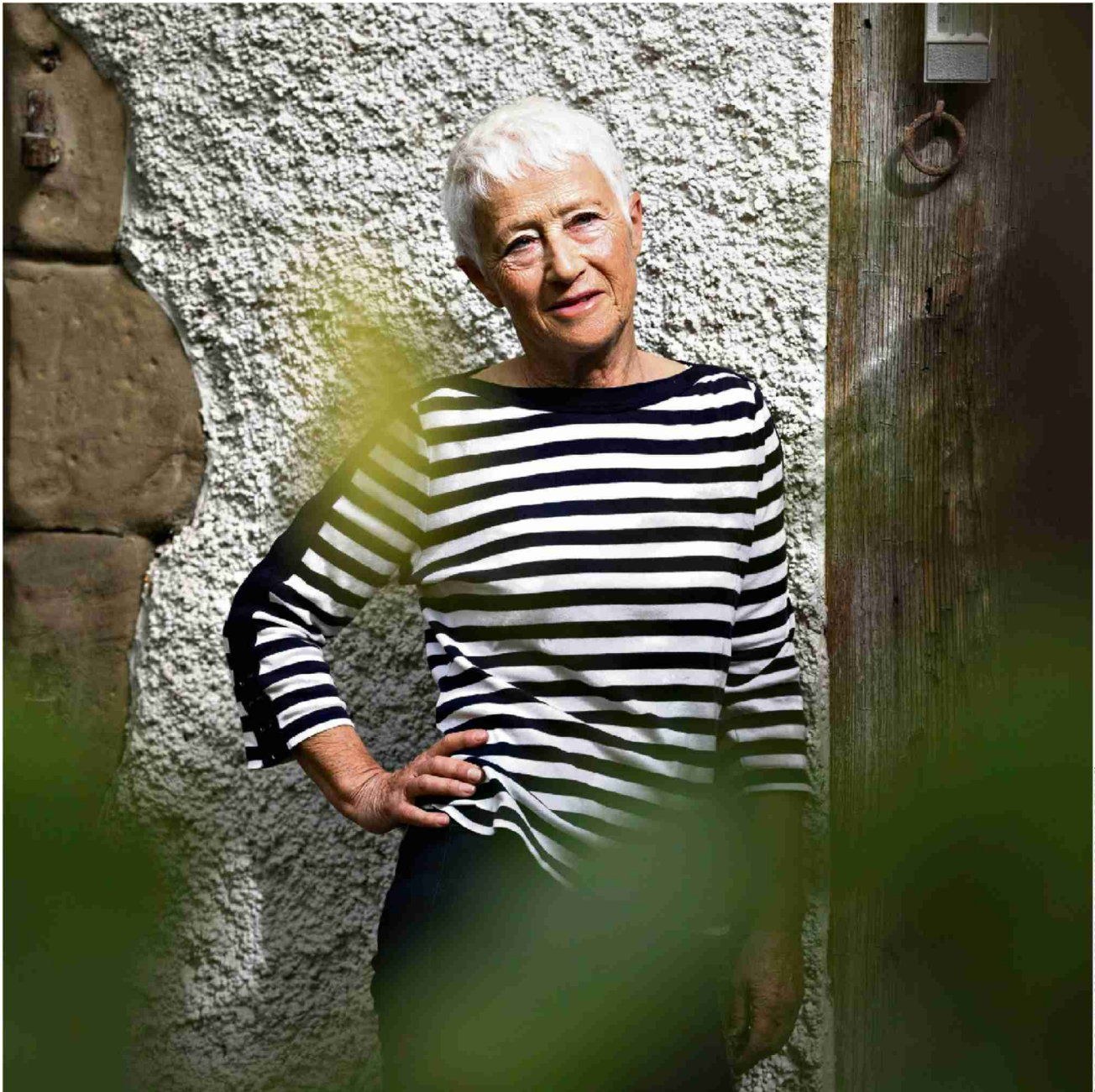
(WEYRIER, 21 JUIN 2024/REBECCA BOWRING POUR LE TEMPS)

Ordre: 844003 N° de thème: 844.003 Référence: 92412658 Coupage Page: 3/3