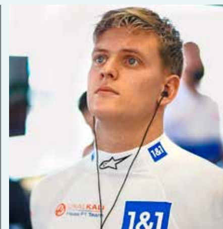
Mick Schumacher Sur les traces de son père

Notre Miss Suisse 2008 ne laisse pas la pandémie l'empêcher de profiter de la République dominicaine, où elle séjourne actuellement. «La version la plus chaude, saine, heureuse et productive de moi-même en gestation», écrit-elle en anglais depuis les plages de Punta Cana. Certains followers n'ont pu s'empêcher d'exprimer leur jalousie devant les images. Mais l'influenceuse vaudoise a refusé de culpabiliser. «Vraiment pas désolée», a-t-elle répliqué.