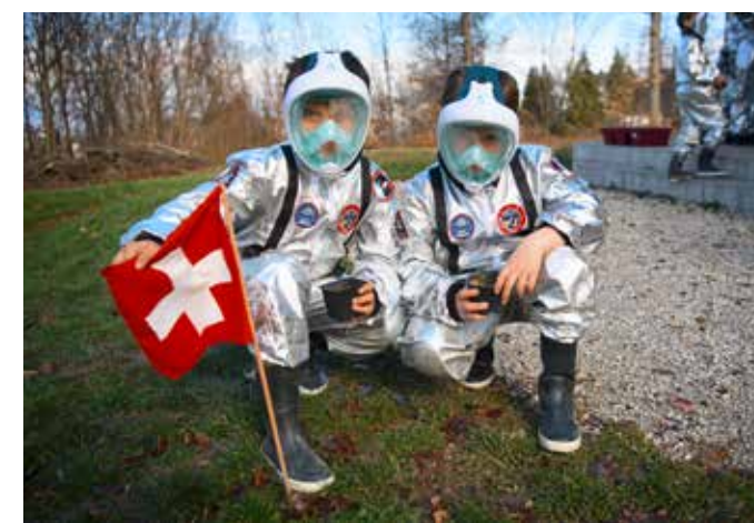
Prêts pour la planète Mars

Ces cinquante dernières années, les Alpes ont perdu un mois d'enneigement à basse et moyenne altitude, selon les conclusions d'une étude qui s'est basée sur les données météorologiques de six pays alpins, dont la Suisse. «Tout porte à croire» que cette dynamique est causée par le réchauffement climatique, selon l'étude relayée par l'Agence télégraphique suisse (ATS). D'ici à 2050, l'enneigement devrait chuter dans des proportions allant de 10% à 40%.