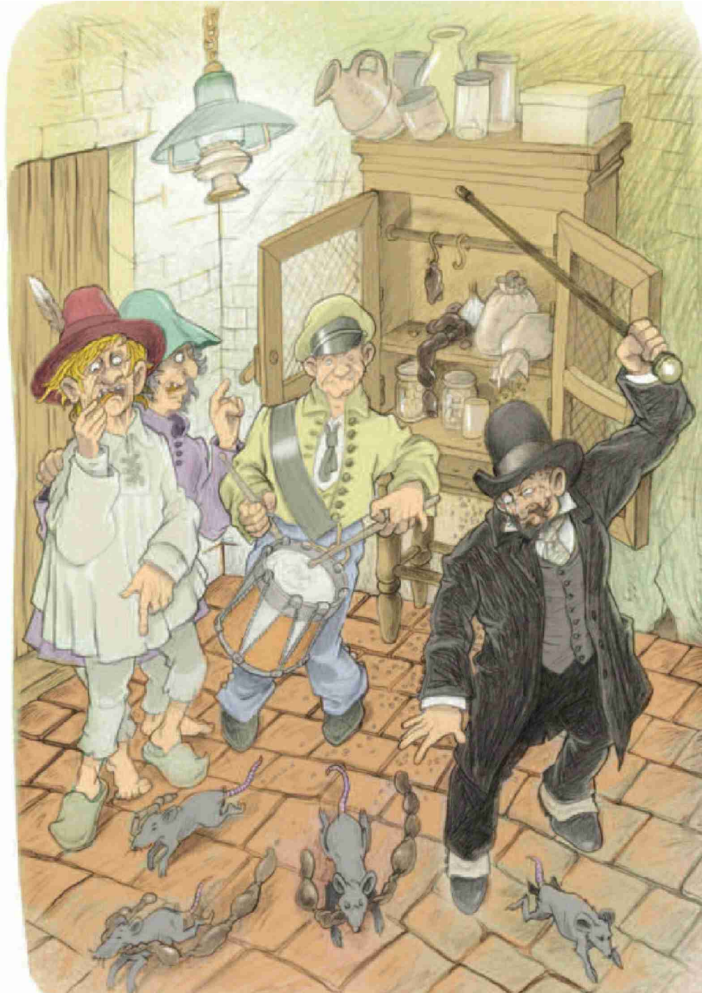
Des souris en train de manger l'esprit que ceux du Peuchapatte – question d'en avoir plus que Le Noirmont et Les Bois à la fois – s'en étaient allés, la veille, acheter, à Morteau. L'un des 33 contes du livre. NICOLAS SJÖSTEDT