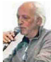
MAURICE SCHOBINGER PHOTOGRAPHE

«Au Mont Blanc, on trouve les plus belles arêtes des Alpes.»