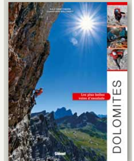
REF. Dolomites, les plus belles voies d'escalade Ralf Gantzhorn Christoph Willumeit Ed. Glénat, Grenoble, 2015

Domage aussi qu'il n'y ait aucun itinéraire de la face nord-ouest de la Civetta qui est certainement une des plus belles et plus hautes des Dolomites. Mais c'est sûrement le reflet