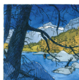
C'est l'élaboration d'une balade qui a conduit à une de nos séries les plus belles : les balades de Dürrenmatt, comme le Suisse, et le Suisse, dans un rayon d'histoire. Suisse, petite montagne, Suisse, tout possible à l'ouvrage. Comme dit-on ? DÜRRENMATT