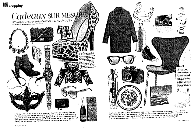
Shopping pp. 28 à 33

N° de thème: 844.3 N° d'abonnement: 844003 Page: 42 Surface: 5'063 mm²