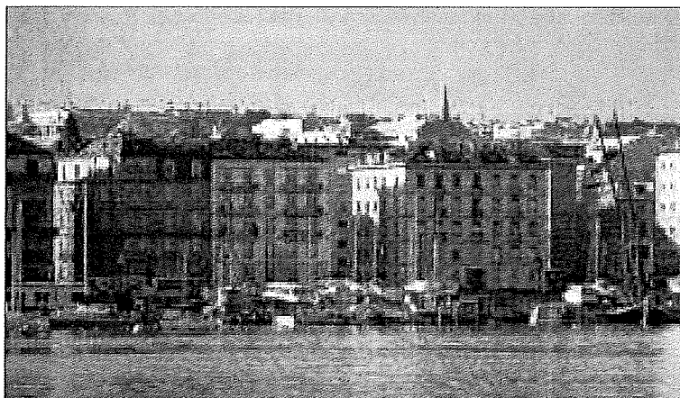
► Genève, victime de son succès?