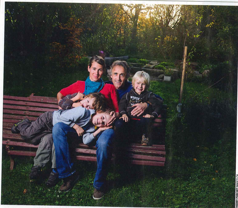
THÉRIY PORCHET / IMAGEZ.CH