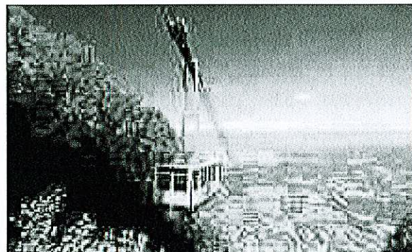
Le téléphérique du Salève fête ses 80 ans. En 2011, il a battu ses records de fréquentation, avec plus de 200'000 visiteurs.

ne se veut pas une série de photos nostalgiques. Nous avons tous des anecdotes, des images qui nous revien-