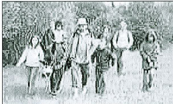
Randonnée avec âne de bât.

Mais il n'y a pas que l'effort. Le Salève ne manque pas de bonnes tables. A commencer par le restaurant panoramique Horizon qui, à l'arrivée du téléphérique, offre une vue imprenable sur Genève. Célèbre table de