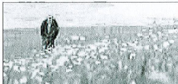
Le Salève offre un incroyable point de vue sur Genève.