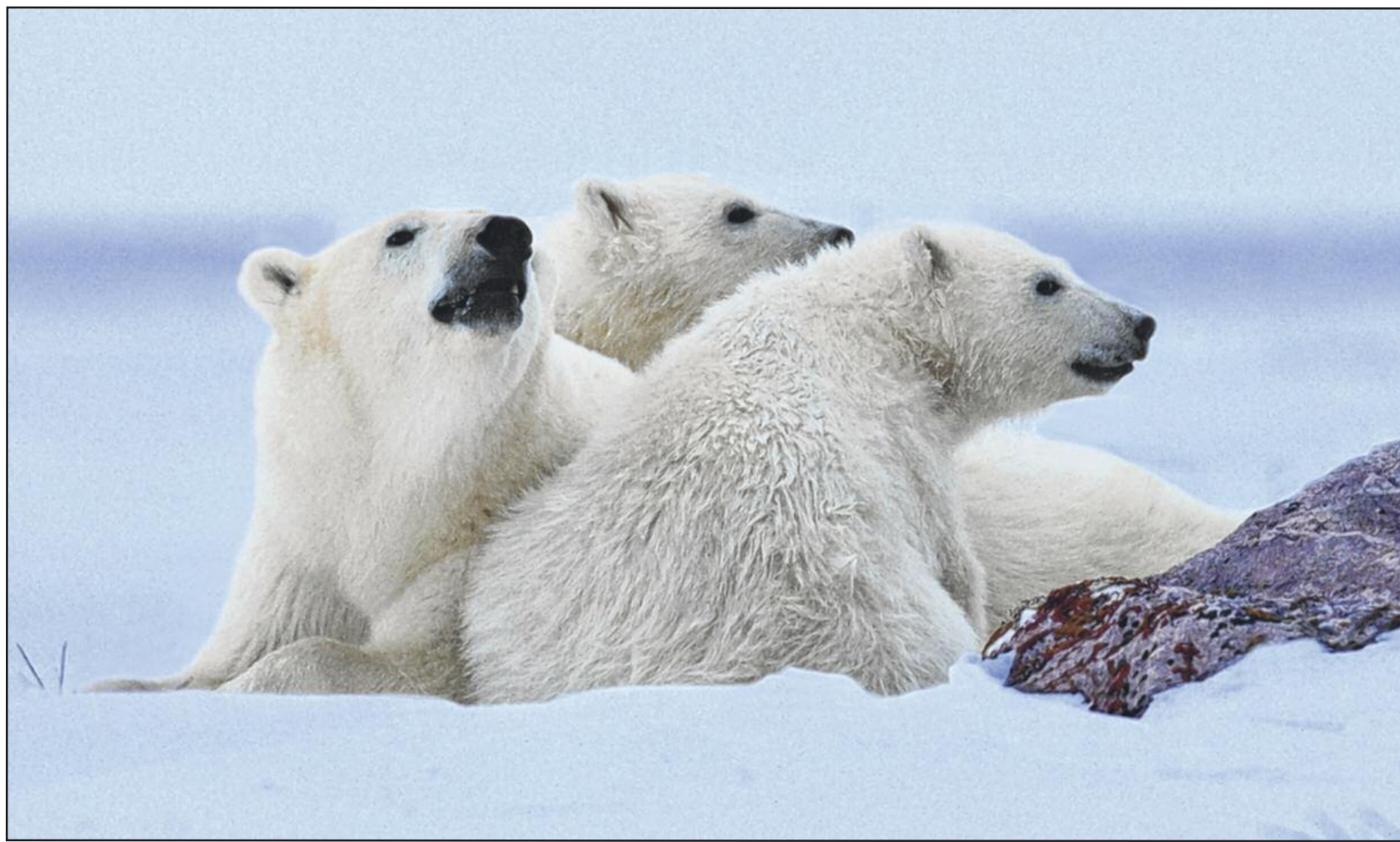
Rencontre souhaitée, mais qui a failli mal tourner dans la baie d'Hudson: une femelle ourse blanche et ses deux oursons de dix mois (1999).