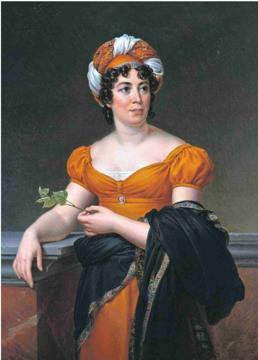
Germaine de Staël (par François Gérard, vers 1810) et Benjamin Constant (anonyme, vers 1815).