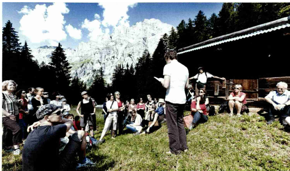
Au festival international de Loèche-les-Bains, des lectures publiques sont souvent organisées en plein air, notamment à la Gemmi.