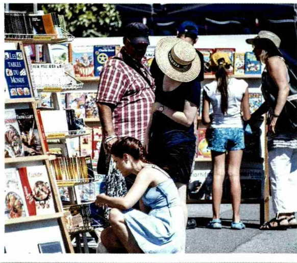
Des stands colorés et dynamiques au Village du livre de Saint-Pierre-de-Clages. Le public apprécie... LE NOUVELLISTE

DÉBAT Festival Rilke, Village du livre, festival international de Loèche-les-Bains, d'Arolla, etc. Les festivals littéraires en Valais sont nombreux. Y a-t-il vraiment de la place pour tout le monde?