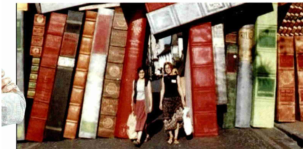
La prochaine édition du Festival Rilke, du 19 au 21 août, aura plusieurs manifestations en pleine ville de Sierre et le public rencontrera des poètes lecteurs.