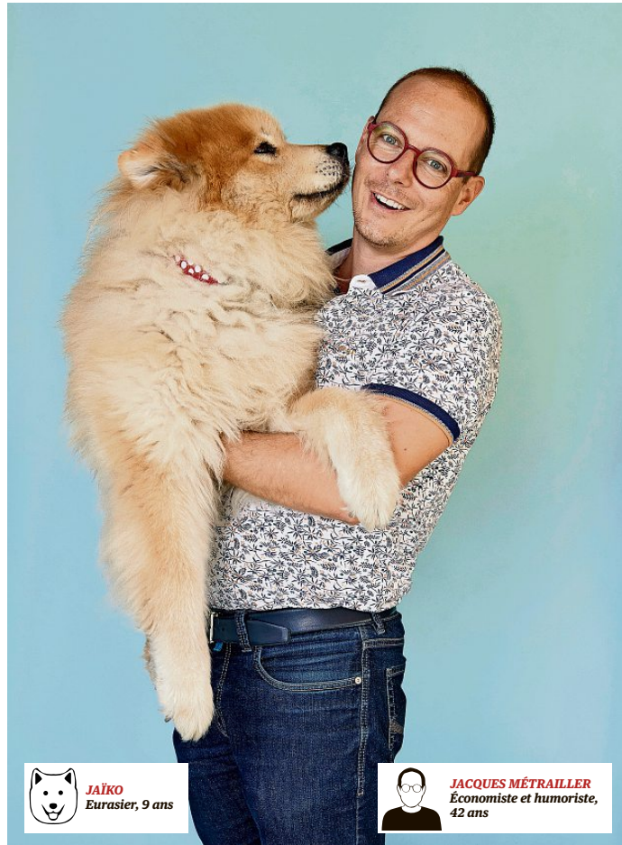
JAÏKO Eurasien, 9 ans

Vous avez envie de raconter votre lien, en texte et images, avec votre animal de compagnie? Écrivez-nous à: lematindimanche@lematindimanche.ch