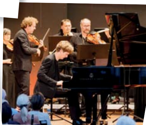
VARIATIONS MUSICALES TANNAY