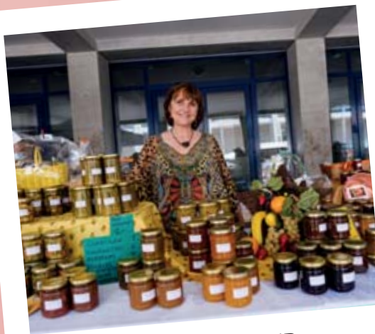
FÊTE DU TERROIR GLAND