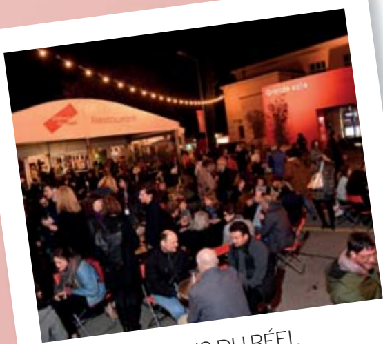
VISIONS DU RÉEL NYON