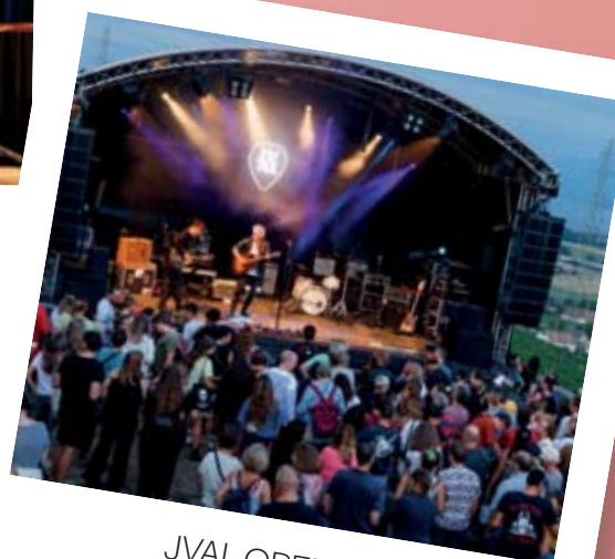
JVAL OPENAIR BEGNINS