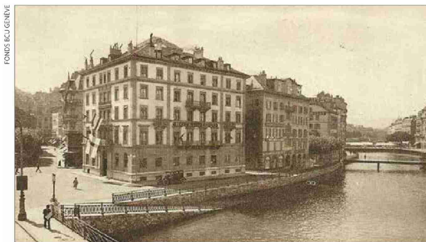
L'Hôtel de l'Écu, vers 1900.

«Une ville à la croisée des chemins, Genève, ses visiteurs et son hôtellerie aux siècles passés», par Charles Heinen, Editions Slatkine.