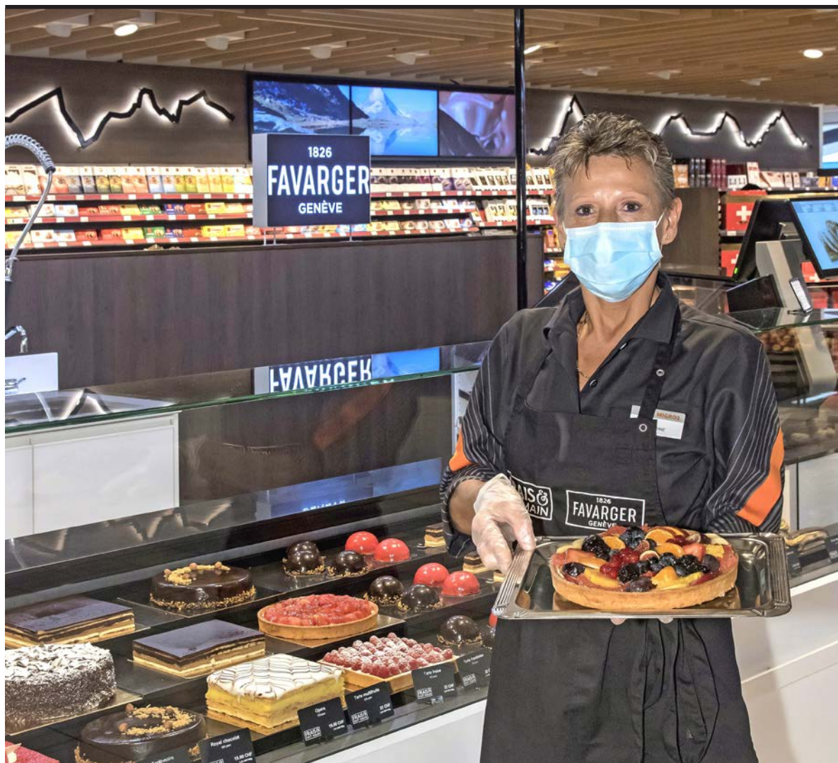
Des pâtisseries exclusives à Migros Balaxert.