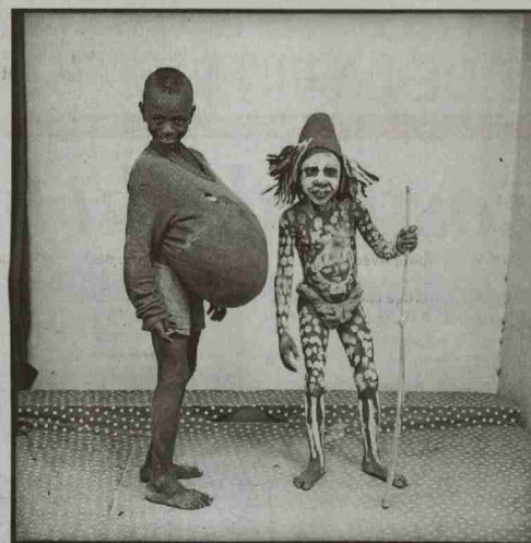
Malick Sidibé, Danseur méringué, 1964 (à gauche); A moi seul, 1978 (en haut à droite); Yokoro, 1970. Malick Sidibé. Courtesy Galerie Magnin-A, Paris