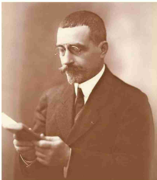
Deux dessins de Gustave Wendt pour «L'école du dimanche» et la photo de Louis Dumur. MAH/ARCHIVES CANTONALES VAUDOISES