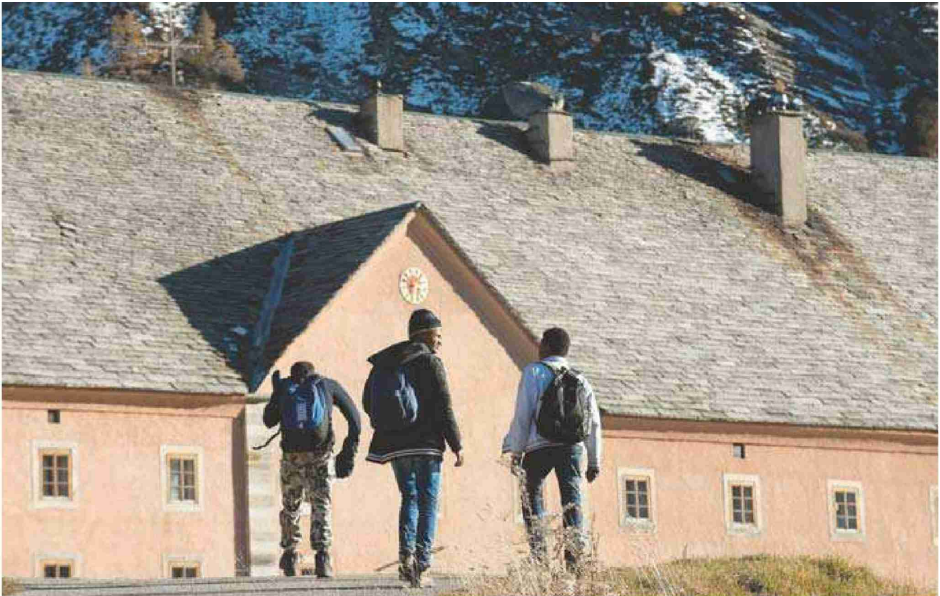
SIMPLON Sur cette image, de jeunes adolescents immigrés en Valais trouvent quelques jours d'évasion à l'hospice. FRANÇOIS PERRAUDIN