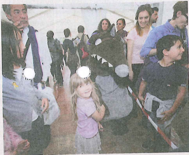
Le loup créé par Oriane Lallemand et Eléonore Thuillier a fasciné les lecteurs juniors. ODILE MEYLAN

ce week-end, jusqu'aux croisières qui affichaient plus de «complet» que l'an dernier. ODILE MEYLAN