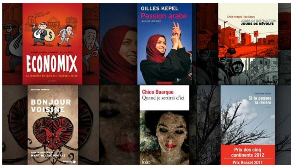
Quelques suggestions de lecture