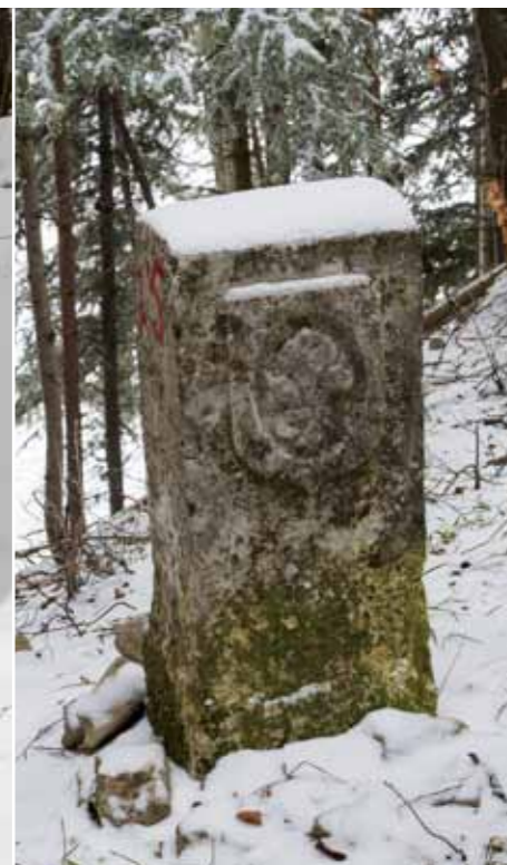
ROYAL A l'origine figuraient trois lys qui ont été cassés (par les révolutionnaires?) et remplacés par un seul.

d'étudier tous les domaines qui m'intéressent.»