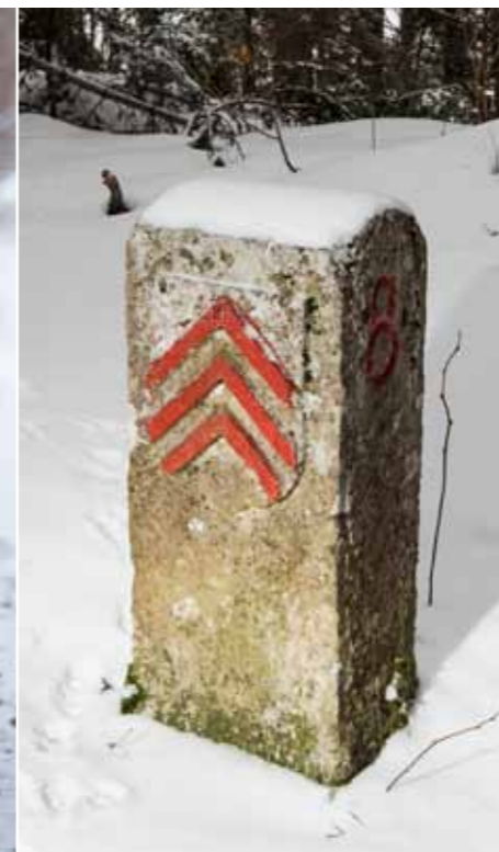
CHEVRONS Les armoiries de Neuchâtel. Le drapeau actuel fut adopté après la révolution neuchâteloise.