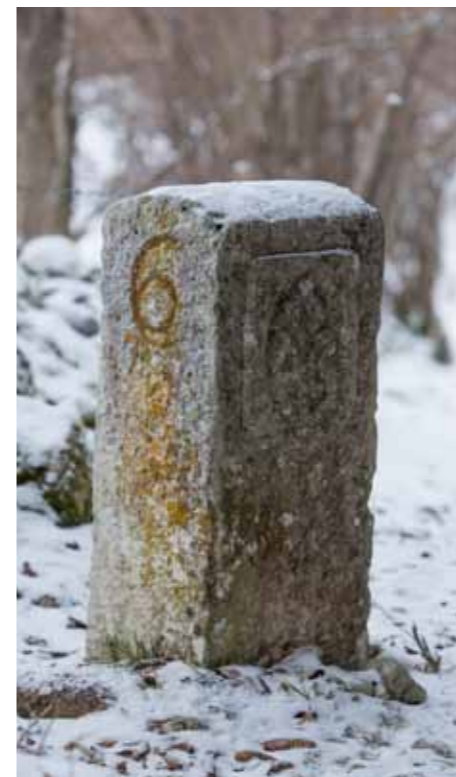
BORNE 6 Elle date de 1766. Jusqu'en 1819, elle était à la vallée de La Brévine où passait la frontière.

Chevrons et lys. «L'histoire comme les randonnées dans la nature sont deux de mes passions. Je suis curieux de bien d'autres choses, mais malheureusement, je n'ai pas le temps