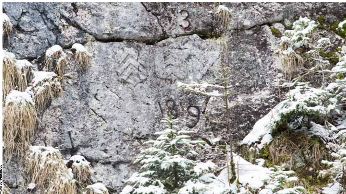
COL DES ROCHES A deux pas du poste de douane abandonné, le rocher des écussons. Ils datent de 1704 (ceux du centre) et de 1766 (ceux des bords). C'est la troisième borne de la frontière franco-neuchâteloise. On y distingue les armoiries de Neuchâtel et de Bourgogne (croix de saint André), et les lys de France (à droite).