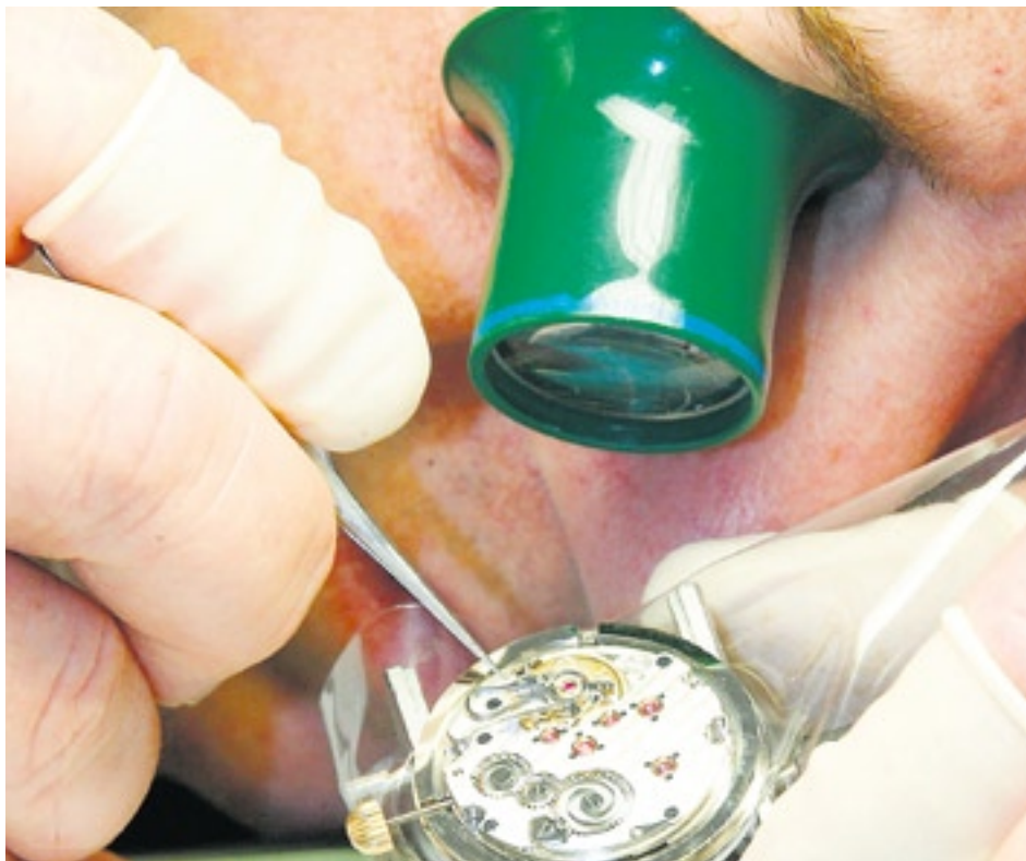
Le secteur horloger est aujourd'hui en plein développement, tout comme celui du bâtiment.

Des secteurs qui restent porteurs Le secteur bancaire et celui de l'industrie subissent quand même des effets négatifs. Mais d'un autre côté, d'autres se développent encore. Le domaine de la construction avec tous les projets d'infrastructures lourdes, le monde horloger, celui des soins, de l'enseignement, sans oublier le monde des services. Ces derniers restent des piliers de l'emploi et de l'économie. Donc inutile d'être alarmiste.