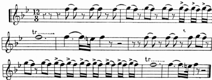
Notation d'une partie du chant du rossignol, d'après la symphonie pastorale de Beethoven.